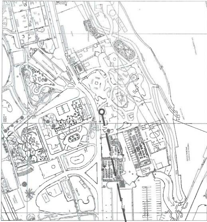
PLANO DE LOCALIZACION