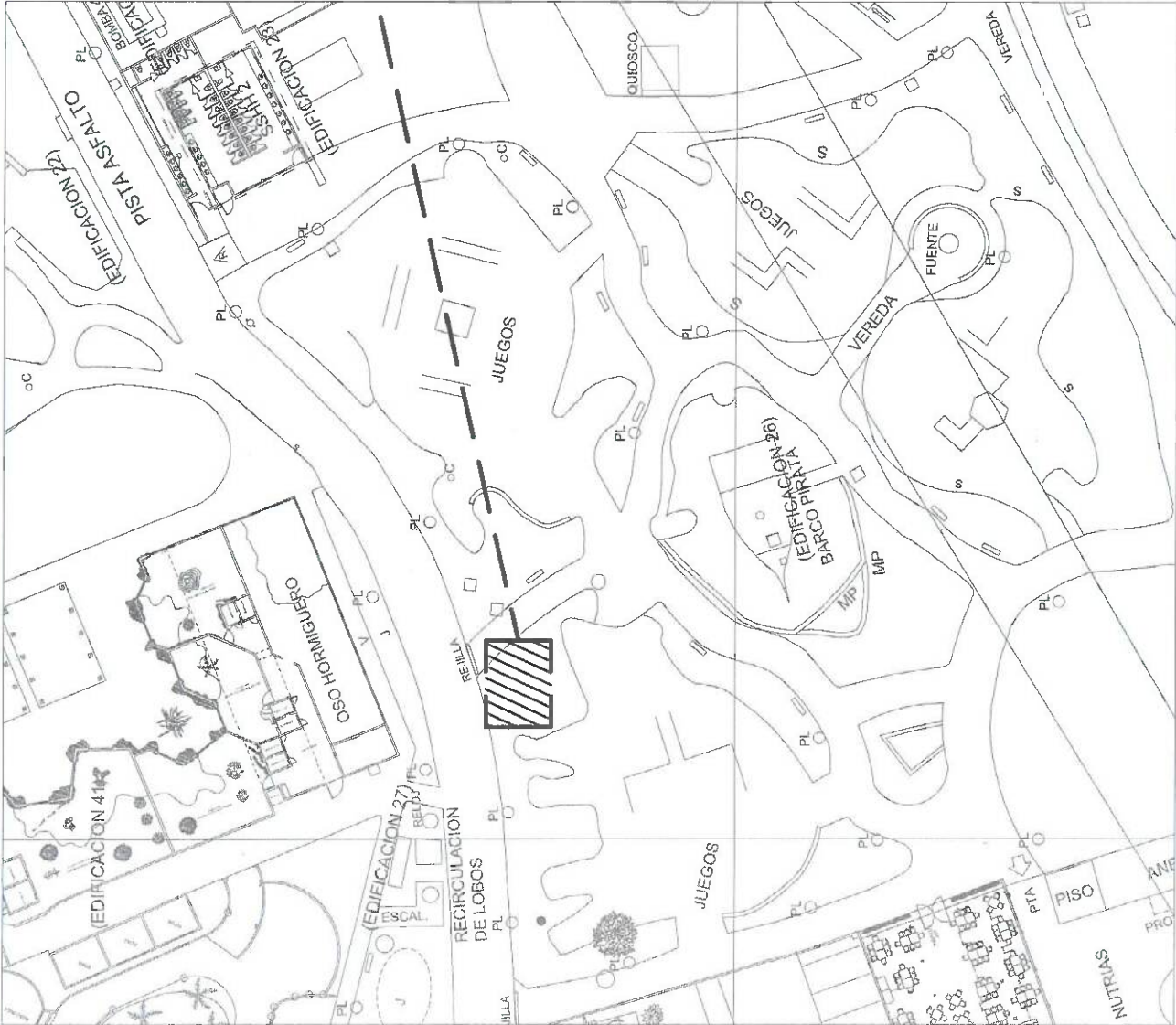
PLANO DE UBICACION